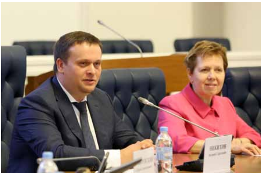
Губернатор Новгородской области Андрей Никитин